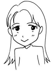
教務 川澄ゆう 中学の時の部活 バレーボール部